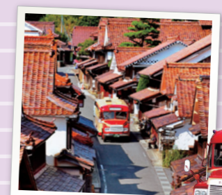
懐かしい吹屋ふるさと村