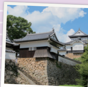
天然の岩盤を巧みに利用した立派な石垣