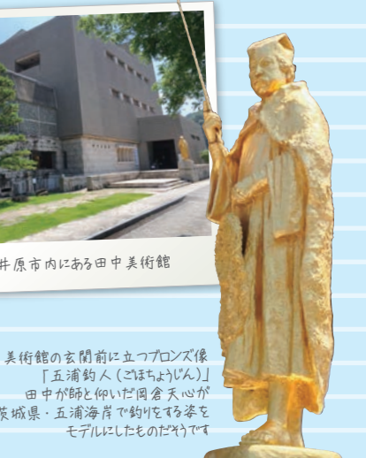
美術館の玄関前に立つブロンズ像 「五浦釣人(ごほちようじん)」 田中が師と仰いだ岡倉天心が 茨城県・五浦海岸で釣りをする姿を モデルにしたものだからです