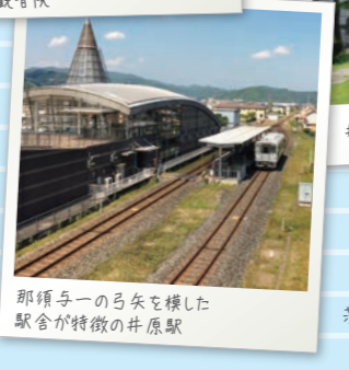
那須与一の弓矢を横した 駅舎が特徴の井原駅