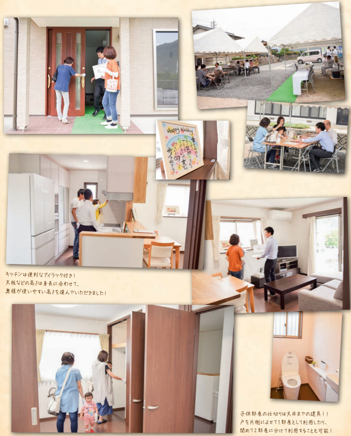
キッチンには便利なアイラック付き! 天板などの高さは身長に合わせて、 奥様が使いやすい高さを選んでいただきました!

6月25・26日の2日間、完成見学会を開催しました。お施様のご年齢は20代!! 20代でも建てられる、要望の詰まった立派な家。両日とも和やかな雰囲気のもと、多くの皆様にご来場していただきました。今後とも、地域の皆様へより良い住まいをご提供できるよう、精進して参りたいと思います。