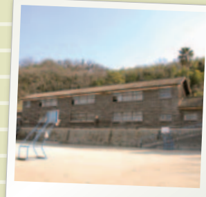
映画のロケにもよく使われる古い校舎