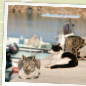
日本でも有数のネコの島「真鍋島」