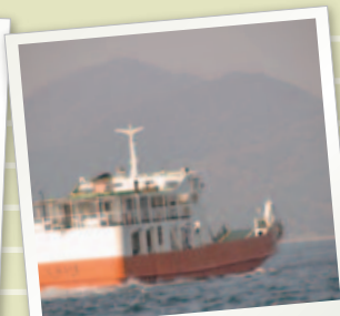
のんびり瀬戸内の風を感じる船旅